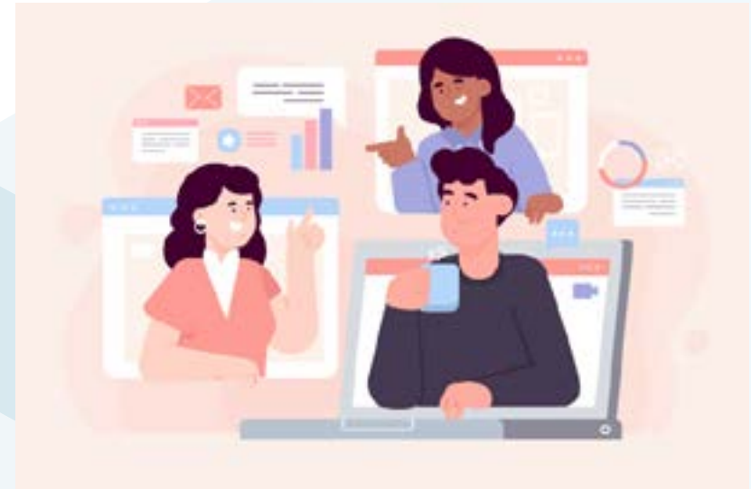
Comunicación efectiva: El espacio formativo permitió conocer diferentes modelos de comunicación y su aporte a la comunicación efectiva.

Esta actividad se desarrolló en atención a las necesidades de capacitación definidas en el diagnóstico general de capacitación, aplicado a todas las oficinas de Ámbito Administrativo, por el Subproceso Gestión de la Capacitación de la Dirección de Gestión Humana para los años 2020 y 2021.