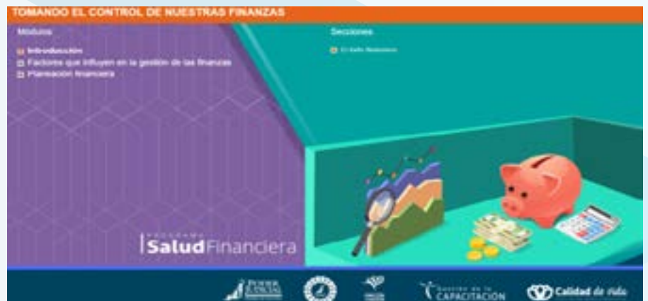
Nuevo curso virtual: Menú principal del curso Tomando el control de nuestras finanzas.