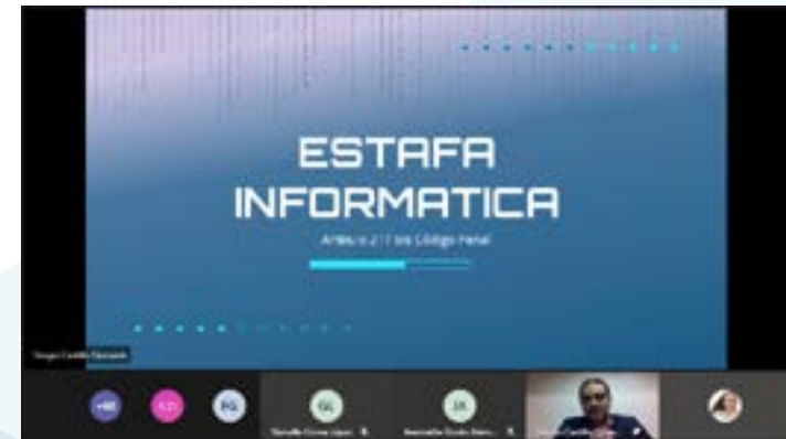
Estafas informáticas: Los delitos informáticos son regulados por el Código Penal.