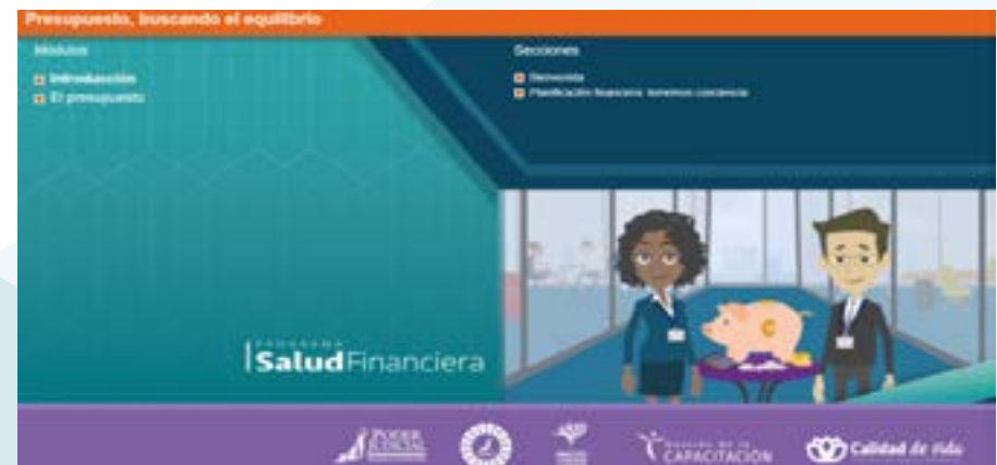
Nuevo curso virtual: Menú principal del curso Presupuesto, buscando el equilibrio de mis finanzas.