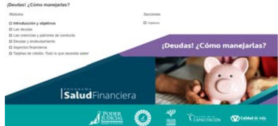
Nuevo curso virtual: Menú principal del curso ¡Deudas! ¿Cómo manejarlas?.

Durante la primera convocatoria de matrícula de estos cursos se inscribieron un total de 438 personas de diferentes oficinas del Poder Judicial.