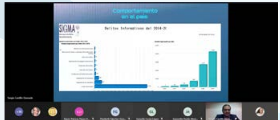
Estafas informáticas: Durante el 2018 y 2020 las denuncias por delitos informáticos aumentaron de manera exponencial, pasaron de 4 mil 200, en el 2019, a más de 13 mil 500 en el 2020.