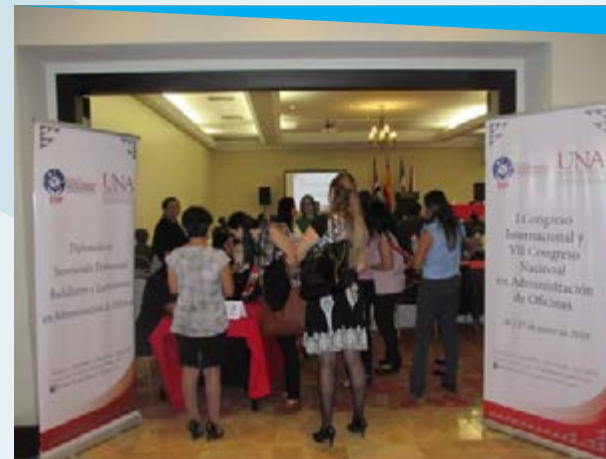
Fotografía de la Escuela de Secretariado Profesional, Universidad Nacional.

El Congreso es un evento académico organizado por la Fundación para la Investigación de la Universidad Nacional, en el que se posibilita la participación de las personas profesionales que se desempeñan en el campo de la administración de oficinas, razón por la cual, el Subproceso Gestión de la Capacitación gestionó la asistencia de las personas servidoras judiciales.