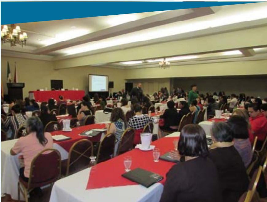
Fotografía de la Escuela de Secretariado Profesional, Universidad Nacional.

Este año la actividad tuvo lugar en el Hotel Wyndhan Herradura, Heredia.