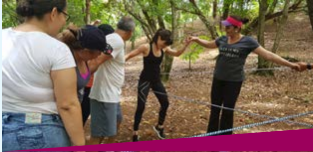
Autocuidado: Trabajo Social y Psicológica de San José

La Dirección de Gestión Humana mantiene su compromiso de promover el bienestar diario y prevenir enfermedades; lo que a su vez contribuye a crear una cultura de salud y alto desempeño en la población judicial.