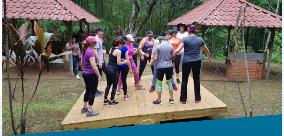
Autocuidado: Trabajo Social y Psicológica de San José