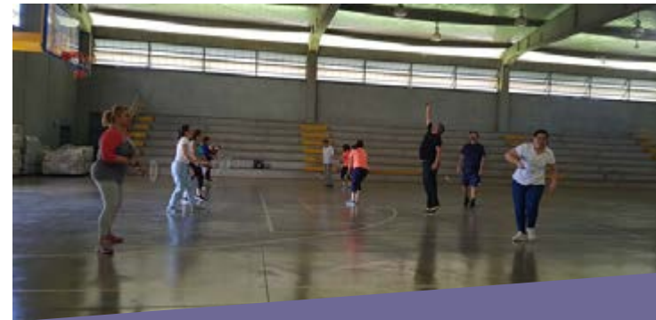
Autocuidado: Trabajo Social y Psicológica de Heredia

El taller buscó que las personas participantes reflexionarán sobre la importancia de incorporar a la rutina diaria estilos de vida más saludables, que ayuden en la prevención de enfermedades como el estrés.