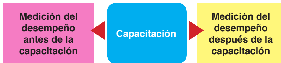
Figura 3 Diseño de medición Pre-test y post-test

Se podría hacer la selección al azar para el grupo experimental (grupo que lleva la capacitación evaluada), si este cuenta con más de sesenta personas. En ese caso se le solicita a una persona especialista en estadística que genere una muestra al azar del grupo, la cual debe estar conformada por al menos 50 personas.