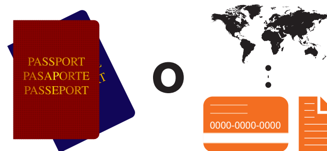
Pasaporte u otro documento del país de origen

*En caso de no contar con la TIM deberá presentar una Constancia de Nacimiento.