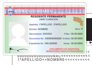
Cédula de residencia o carné de refugiado