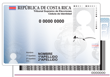
Cédula de identidad