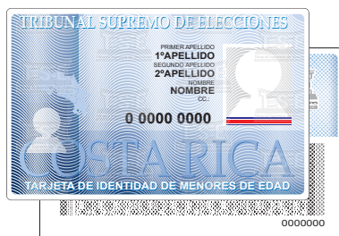
Tarjeta de Identificación de Menores de Edad (TIM) (de 12 años a 18 años)

*En caso de no contar con la TIM deberá presentar una Constancia de Nacimiento.